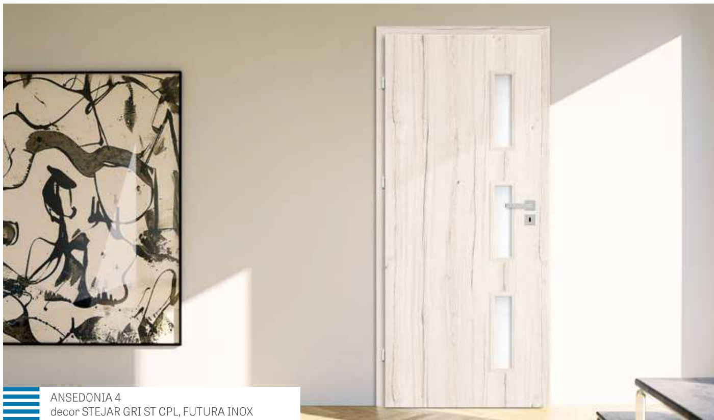
ANSEDONIA 4 decor STEJAR GRI ST CPL, FUTURA INOX

CANAT DE UȘĂ CU RAME INSTALATE ÎN INTERIOR FĂLȚUITĂ, NEFĂLȚUITĂ ȘI CU REVERSIE